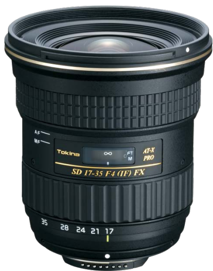
TO-1735 (N/C) f/4.0